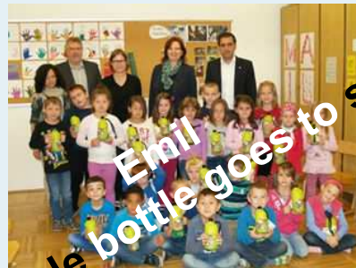
returnable bottle goes to school