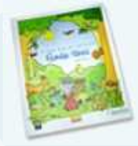
Book for kids