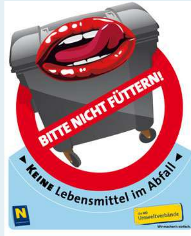
No food in waste