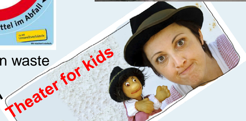
Theater for kids