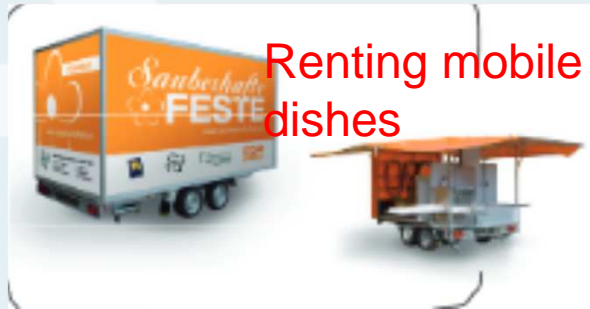
Renting mobile dishes